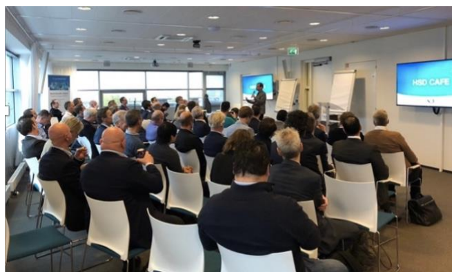
> HSD Café, februari 2020

We organiseerden HSD Cafés op onderwerpen als OT security, AI, crisismanagement, funding en internationalisering. Tijdens de HSD Cafés delen we kennis, inventariseren we of innovatieve ideeën aanslaan en vinden we samenwerkingspartners voor nieuwe programma's. De bijeenkomsten zijn toegankelijk voor iedereen en zijn met gemiddeld 100 deelnemers (fysiek) en 60 (digitaal) goed bezocht.